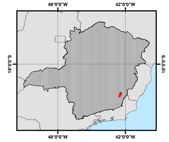
Localização no Estado